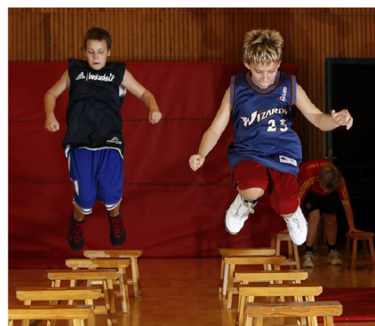
IDRÆT OG BEVÆGELSE TIL ALLE Gentofte Kommunes idræts- og bevægelsespolitik 2009 - 2012